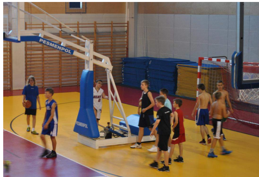
Obóz sportowy koszykarzy, sierpień 2015r.